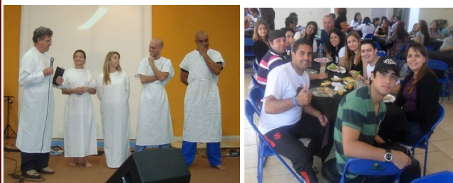
Batismo - 19/06