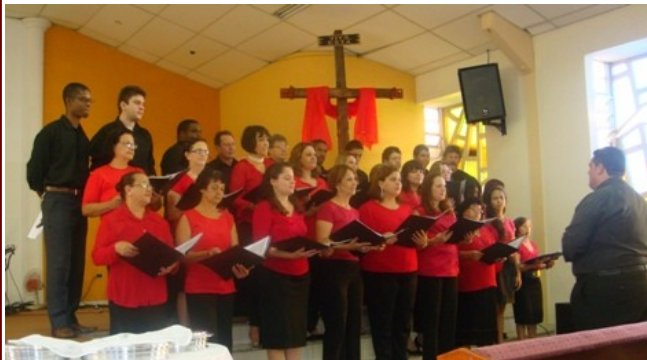
Aniversário do Coral Nazareno - 03 de junho