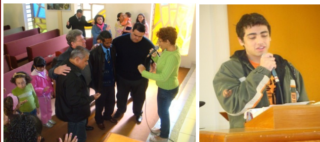
Dia do pastor - 12/06 - Homenagem da Escola Dominical