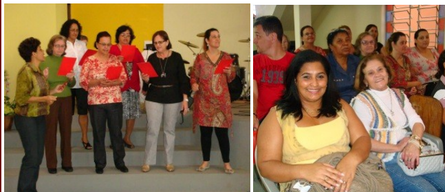
Reunião de mulheres na II Igreja - 25/06

"O Senhor dá força ao seu povo , o Senhor abençoa com paz ao seu povo". Salmos 29:11