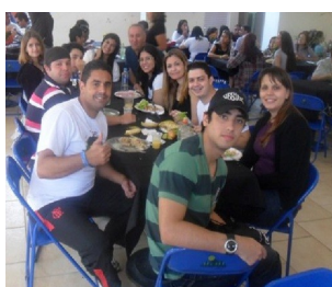
Viagem - JNI - 23 a 26/06