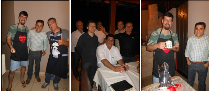
Palestra para o Grupo Idade com qualidade - dia 2 de agosto