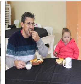
REUNIÃO DE HOMENS – 11 DE JUNHO