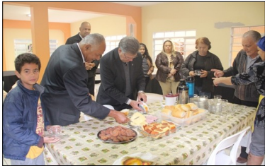
CAFÉ DA MANHÃ – 5 DE JUNHO