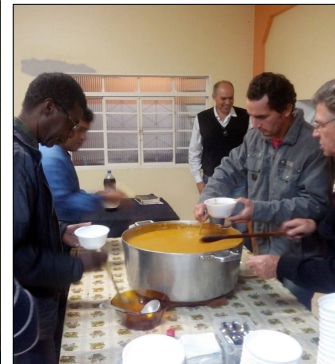
CULTO – 12 DE JUNHO