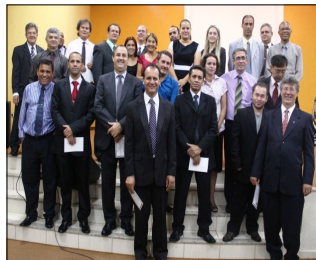
Culto distrital realizado no dia 18 de janeiro