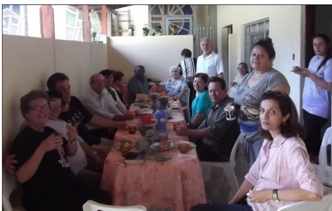
Ministério Melhor idade - todos os sábados