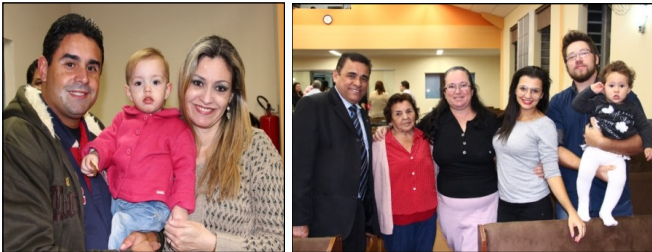
Visita dos adolescentes e jovens na Casa de Repouso Filadélfia no dia 22/6. Além de levarem barras de chocolate, eles louvaram e oraram com os idosos que ali estão hospedados.